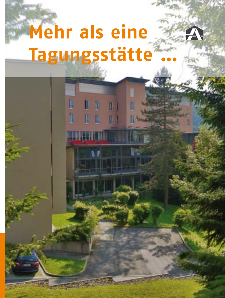
Layout: rfs, Karlsruhe