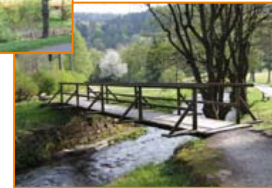
Das Flüßchen Alb entspringt unterhalb der Teufelsmühle südlich von Bad Herrenalb auf etwa 760 m Höhe.