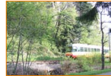
Bequeme Anreise durchs Albtal mit ICE-Anschluss in Karlsruhe

Entspannen Sie sich im Thermalbad Bad Herrenalb oder unternehmen Sie Ausflüge in die umliegenden Städte Calw, Baden-Baden, Ettlingen und Karlsruhe.